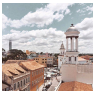
Figura 4: Imagem postada no dia 28 de julho