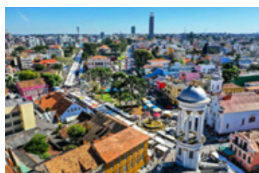
Figura 6: Imagem postada no dia 11 de agosto