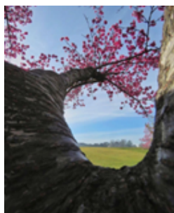
Figura 2: Imagem postada no dia 22 de julho