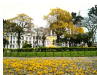
Figura 9: Imagem postada no dia 9 de setembro