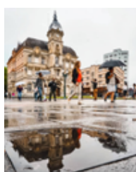
Figura 8: Imagem postada no dia 6 de setembro